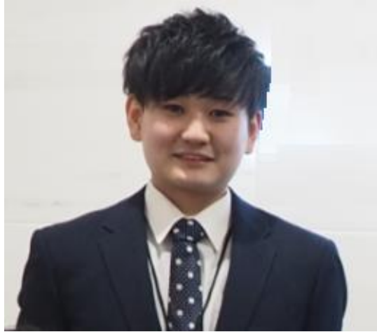
クラウドソリューション2課 H.S