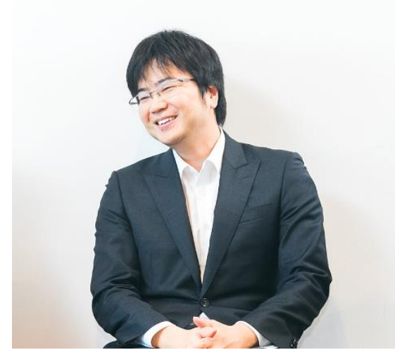
クラウドソリューション2課 T.S